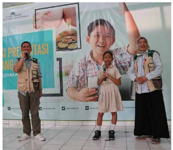
Sebagai langkah nyata dalam menggenarkan edukasi literasi keuangan; tim Yayasan Manulife Peduli (YMP) melakukan kunjungan ke SDN Winongo, salah satu Sekolah Binaan Manulife. As a concrete step in intensifying financial literacy education; the Yayasan Manulife Peduli (YMP) team visited Winongo Elementary School, one of Manulife's target schools.