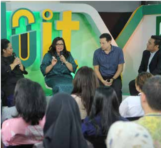
Manulife Indonesia dan Yayasan Manulife Peduli kembali integrasikan program CSR Zoning dengan program TV andalannya di Metro TV DO IT. Manulife Indonesia and Yayasan Manulife Peduli re-integrate the Zoning CSR program with its flagship TV program on Metro TV DO IT.