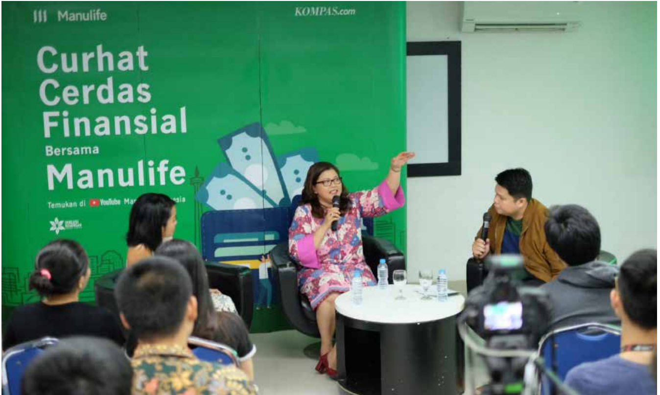
Manulife Indonesia menggelar kegiatan Curhat Cerdas Finansial. Manulife Indonesia hosted Curhat Cerdas Financial activity.